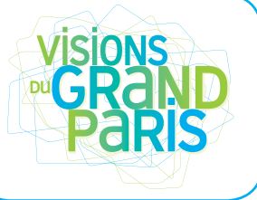
TABLE RONDE - AUDITORIUM - 14 H à 16 H